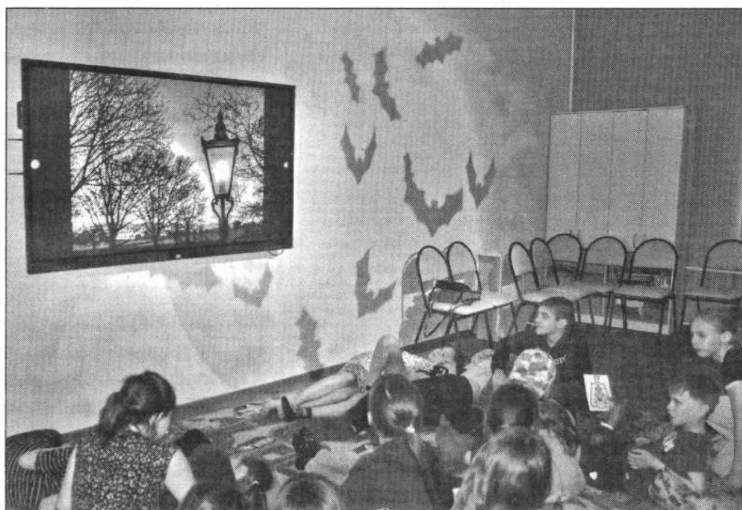
■ ...или послушать историю, лёжа на ковре под тёплым светом фонаря

Мероприятия сопровождаются выставками научно-популярной литературы, инсталляциями, где всё можно потрогать, понюхать и даже попробовать. В День хлеба, например, дети с интересом щупали колоски, зёрна пшеницы, муку, а в День чая рассматривали образцы разных сортов ароматного напитка (чёрного, белого, зелёного, красного).